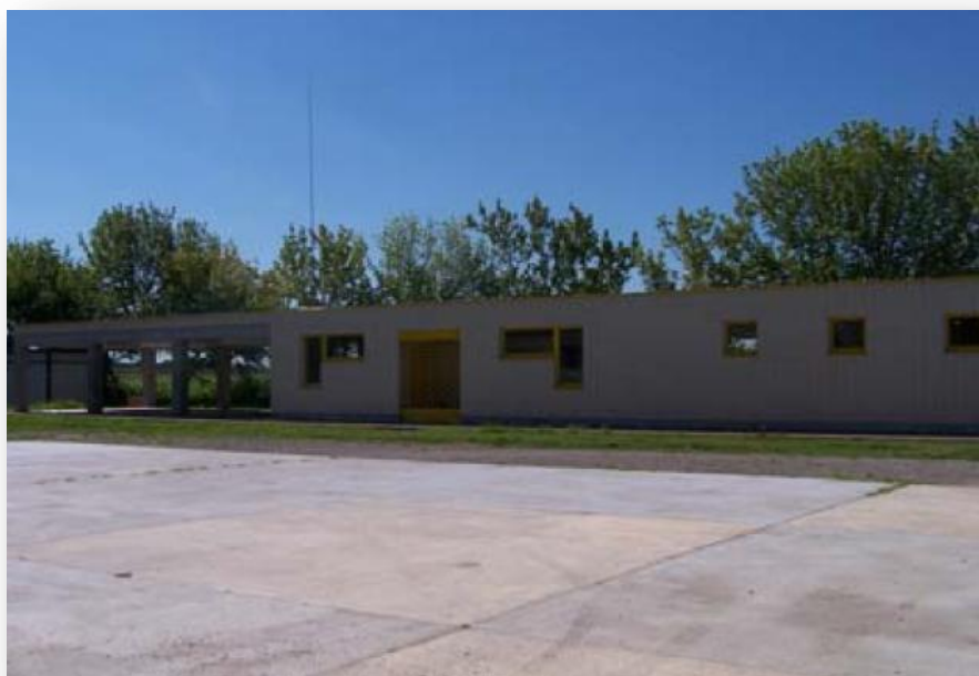
Figura 6 Sede del Gruppo di Protezione Civile

Il Comune di Valle Salimbene ha istituito un proprio Gruppo Comunale di Protezione Civile che si occupa del monitoraggio del territorio; il Gruppo ha una sede operativa presso la struttura del Comune in Via Valle 4 dove si trova anche il magazzino comunale.