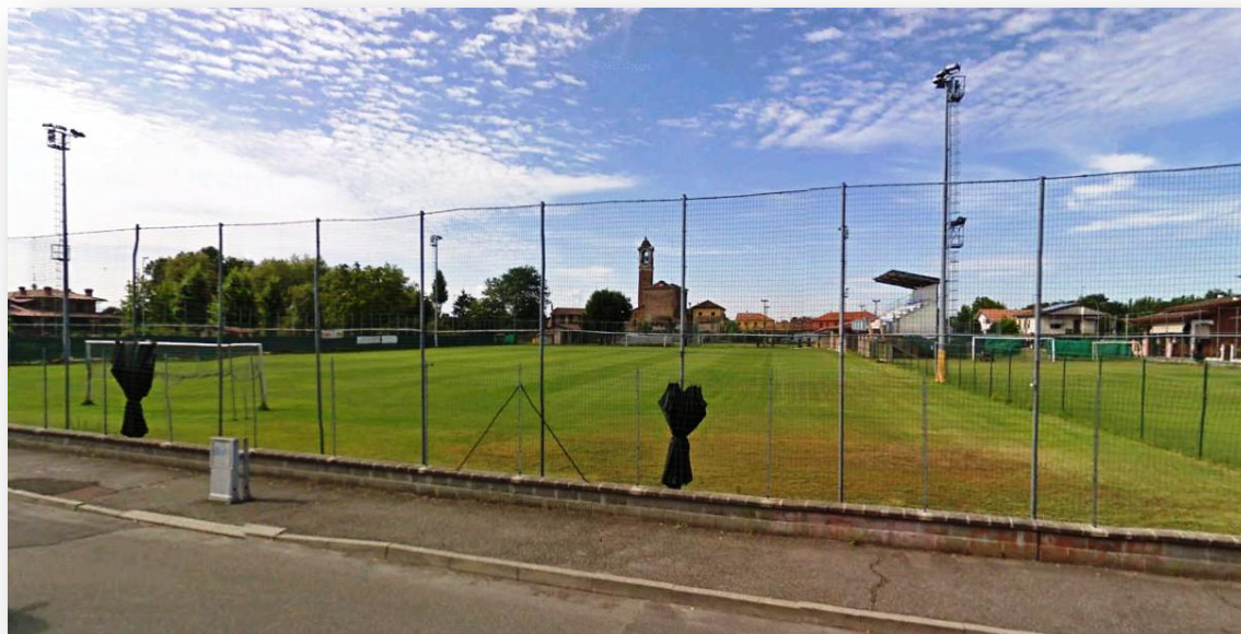
Figura 1 Vista del Campo Sportivo dell'Oratorio di San Leonardo

Oltre alle sedi istituzionali, quali il municipio, sono state individuate anche altri edifici adatte a diventare strutture di emergenza in caso di necessità quali scuole, centri sportivi, oratori, ecc..