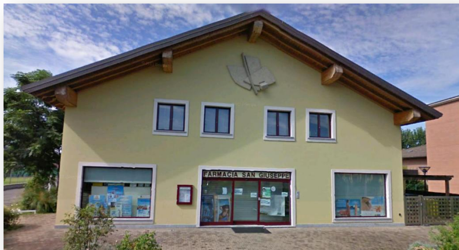
Figura 5 La Farmacia San Giuseppe in frazione San Leonardo