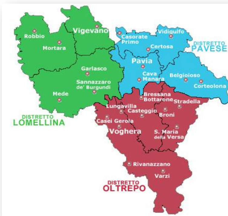
Figura 3 I distretti sanitari dell'ASL di Pavia

Il territorio dell'ASL di Pavia è diviso in tre Distretti Socio-Sanitari, ognuno dei quali ha una sede principale ed una serie di sedi diffuse in modo da facilitare l'accesso dei cittadini.